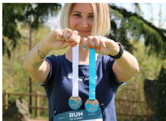
Run for Planet by Ethics Event

La démarche de sensibilisation a été très appréciée et sera renouvelée lors des prochaines éditions.