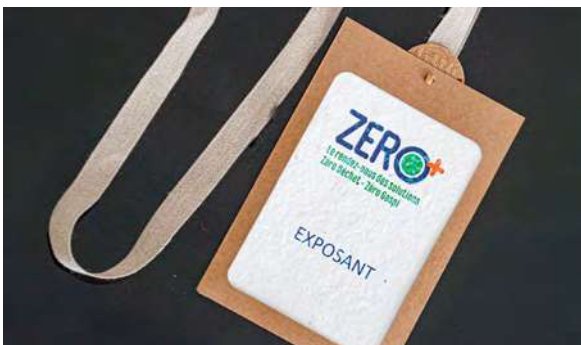
Aibre à bulles

Lors de la visite du pape à Marseille, les terrasses des brasseries du Vieux-Port ainsi que les chemins de randonnée étaient jalonnés de marcheurs abrités sous des chapeaux distribués la veille au Stade Vélodrome. Ces objets ont rencontré un grand succès lors de l'évènement, ont été utilisés tout le week-end et sont désormais des articles de collection de cet instant mémorable.